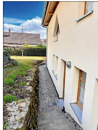
Verbesserung der Entwässerungsmöglichkeiten durch weitere Abläufe/Fallrohre und eine zusätzliche Entwässerungsrinne

In den Innenräumen musste, nach einer längeren Trockenphase mit Bautrocknern, ein neuer Bodenbelag verlegt und die Wände neu tapeziert werden. Diese Arbeiten waren im November vergangenen Jahres erledigt, so dass die Gruppenräume seitdem wieder genutzt werden konnten. Für den Zugang zum Untergeschoss und die Nutzung des betroffenen Gartenbereiches standen noch weitere Arbeiten rund ums Gebäude an.