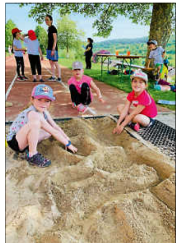
Auf der Suche nach Schatten

In dieser Woche fand an der Grundschule Egenhausen unter der Mithilfe zahlreicher Eltern und der Lehrer die diesjährigen Bundesjugendspiele statt. Aufgrund der Pandemie und des damit verbundenen Kohortenprinzips, entfiel das gemeinsame Aufwärmprogramm. Traditionellen werden aus vier Disziplinen - 50-Meter-Lauf, Weitsprung und Ballweitwurf, Ausdauerlauf über 800m bzw. 1.000m - die drei besten Ergebnisse gewertet. Bei heißem Wetter konnten sich die Schülerinnen und Schüler bei einem Wassertransport auf dem Schulhof etwas Abkühlung verschaffen.