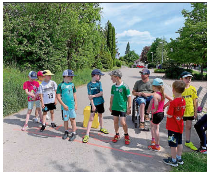
Ausdauerlauf über 800 bzw. 1000m