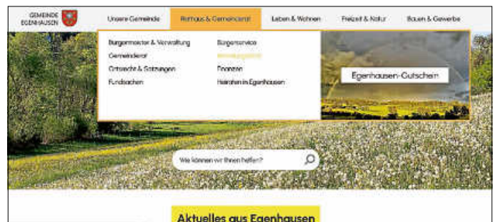
Die neue Homepage der Gemeinde ist auch auf mobile Endgeräte abgestimmt.

Die neue Homepage der Gemeinde Egenhausen geht in dieser Woche online! Gemeindegammlerer Daniel Merkle gab in der Sitzung einen kleinen Vorgeschmack vom neuen Design. Die Homepage beinhaltet unter „Bürgerservice“ künftig einige Formulare, welche online ausgefüllt werden können. Dieser Service soll nach und nach ausgebaut werden. Künftig sind auch alle Satzungen und Bebauungspläne zum Download verfügbar sowie die öffentlichen Unterlagen zu den Gemeinderatssitzungen unter der Rubrik Bürgerinformationssystem einsehbar. Für die Vereine, Kirchen und Unternehmen wird weiterhin der kostenlose Service angeboten, sich auf der Homepage darzustellen. Hier ist die Gemeinde jedoch auf die Mithilfe der einzelnen angewiesen, evtl. Änderungen zeitnah zu melden, um die Informationen auf der Homepage aktuell halten zu können.