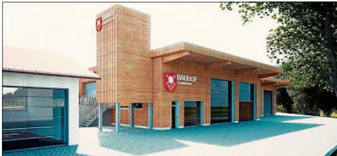
Die geplante neue Bauhofhalle

Zu den vorgelegten fünf Bauvorhaben erteilte der Gemeinderat einstimmig seine Zustimmung. Neben zwei Wohnhausneubauten in der Sonnenreute und Im Brühl, befand sich darunter auch die geplante Erweiterung und Sanierung des Bauhofes. Die ehemalige Turnhalle soll abgebrochen und an ihrer Stelle eine größere Halle erstellt werden, um ausreichend Kapazität für den Bauhof bieten zu können. Außerdem wird das bestehende Bauhofgebäude und das Außengelände saniert und auf heutige Erfordernisse angepasst.