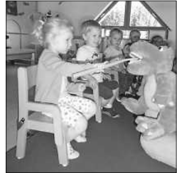
Mit einer extra großen Zahnbürste konnten die Zähne von Kroko geputzt werden.

Wir bedanken uns ganz herzlich bei Frau Schuon für die freundliche und kindgerechte Zahnprophylaxe.