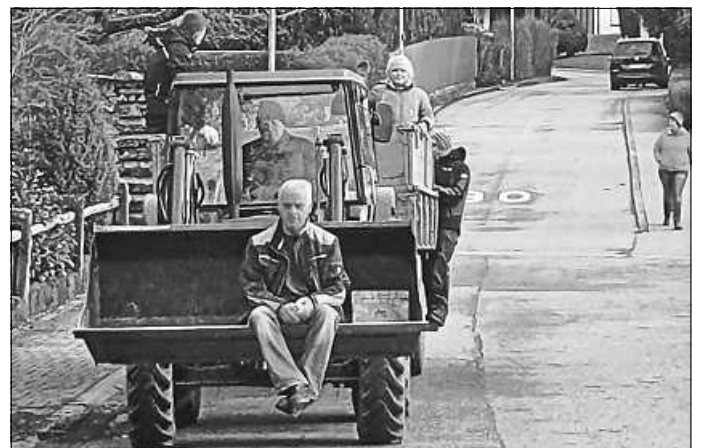
....gemeinsam hatten wir auch viel Spaß bei der Aktion

Mit vielen Helfern und zwei Traktoren starteten wir unsere Tour im Flecken. Die eine Truppe machte sich auf in Richtung Siedlung, die anderen zur Chaussee hinauf. Schön, dass unsere Konfis mit viel Motivation auch dabei sein konnten.