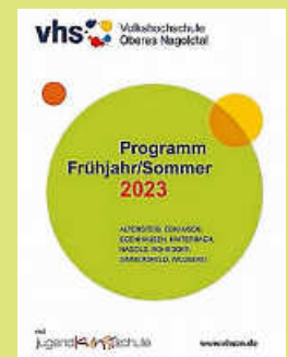
Titelblatt Programmheft FS 2023

Alle Angemeldeten werden von uns immer aktuell informiert. Wir freuen uns auf Sie!