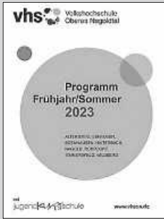
Titelblatt Programmheft FS 2023