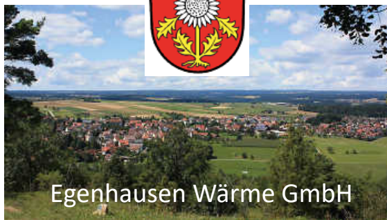
Egenhausen Wärme GmbH