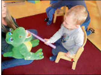
Krokos Zähne konnten mit einer riesigen Zahnbürste geputzt werden.

Als Nächstes holte sie „Kroko“, das große Kuschelkrokodil aus ihrer Tasche.