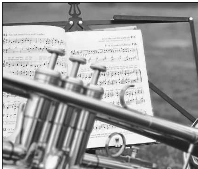
Frühblasen im Berg