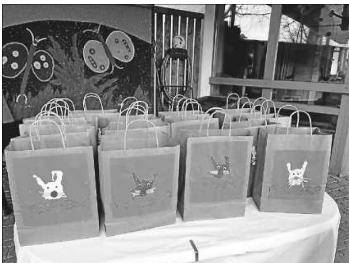
Jede Familie erhielt eine mit handabdrücken verzierte Vespertüte.

Zum Ausklang der gemeinsamen Osterfeier gab es für jede Familie eine Vespertüte, die die Kinder an den Tagen zuvor mit Handabdruckhasen verziert hatten. So konnten sich die Kinder und ihre Eltern im Garten der Kinderkrippe Getränke, Hefezopf und etwas Obst schmecken lassen. Trotz des kalten Wetters nutzten Eltern und Kinder die Zeit, sich zu unterhalten oder im Garten zu spielen, bevor sie sich in das bevorstehende Osterwochenende verabschiedet haben.