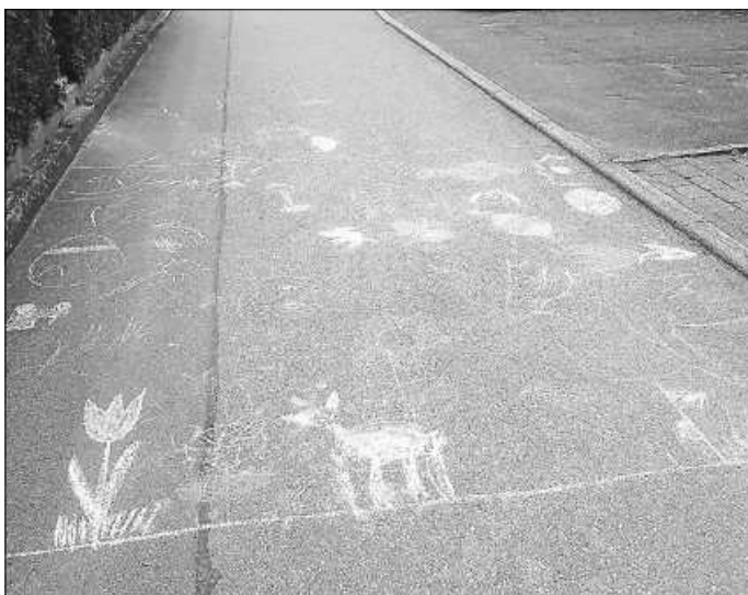
An einer Station entstand mit Kreide eine bunte Frühlingswiese.

Jedes Krippenkind, das alle Aufkleber gesammelt hatte, durfte dann im Garten sein Ostergeschenk suchen.