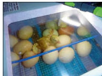
Die Kinder konnten das Schlüpfen der Küken miterleben.