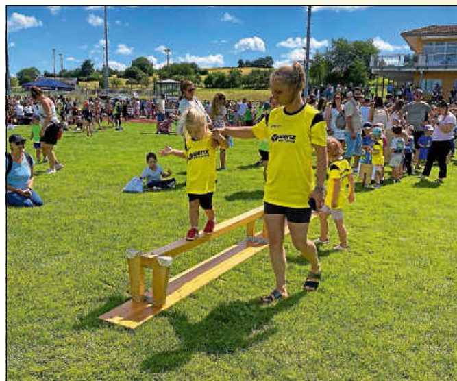
Balancieren über die Wackelbank

Herzlichen Glückwunsch an die Athleten, starke Leistung, wir sind sehr stolz auf Euch.