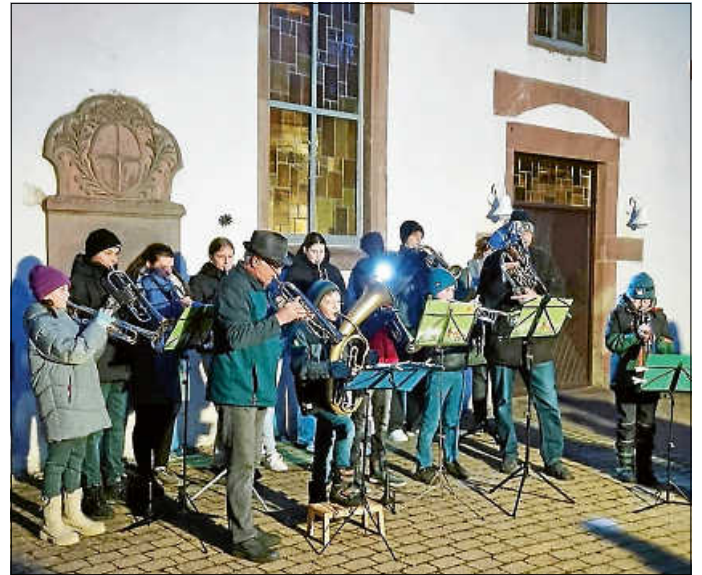
Auf dem Kirchplatz erklingen Weihnachtslieder.

Gemeinsam mit den Jungbläsern aus Walddorf, deren Jungbläserleiter und unterstützt von Bläsern(-innen) aus dem Chor in Egenhausen ging es am Nachmittag Richtung Kirchplatz.