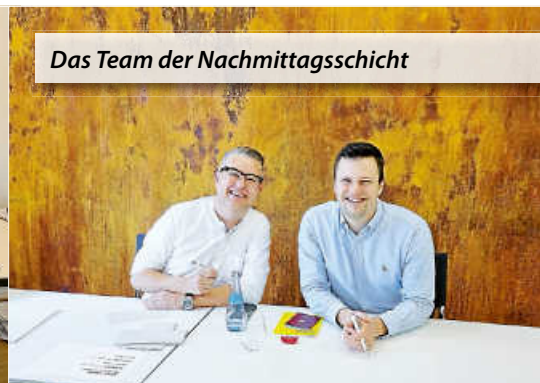
Das Team der Nachmittagschicht