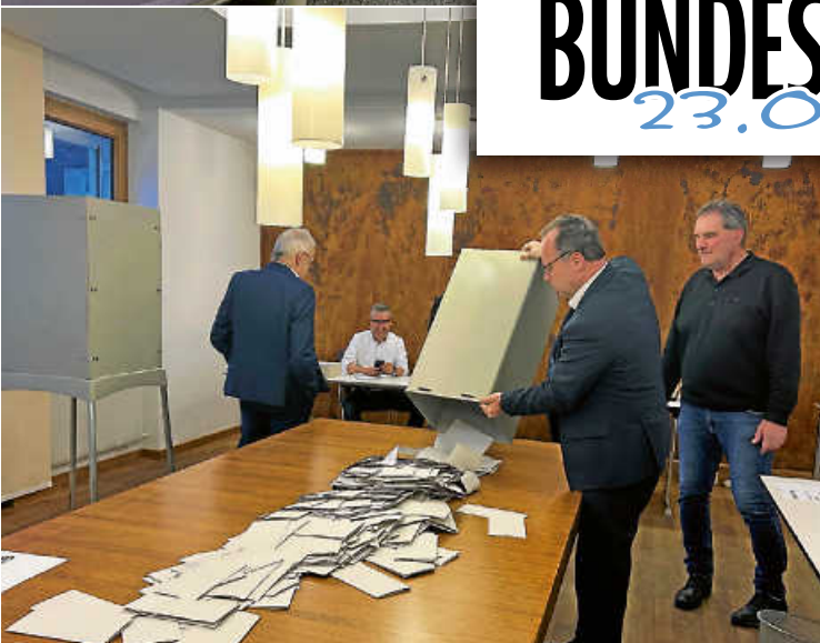
Punkt 18:00 Uhr wurden die Stimmzettel ausgeleert und gezählt