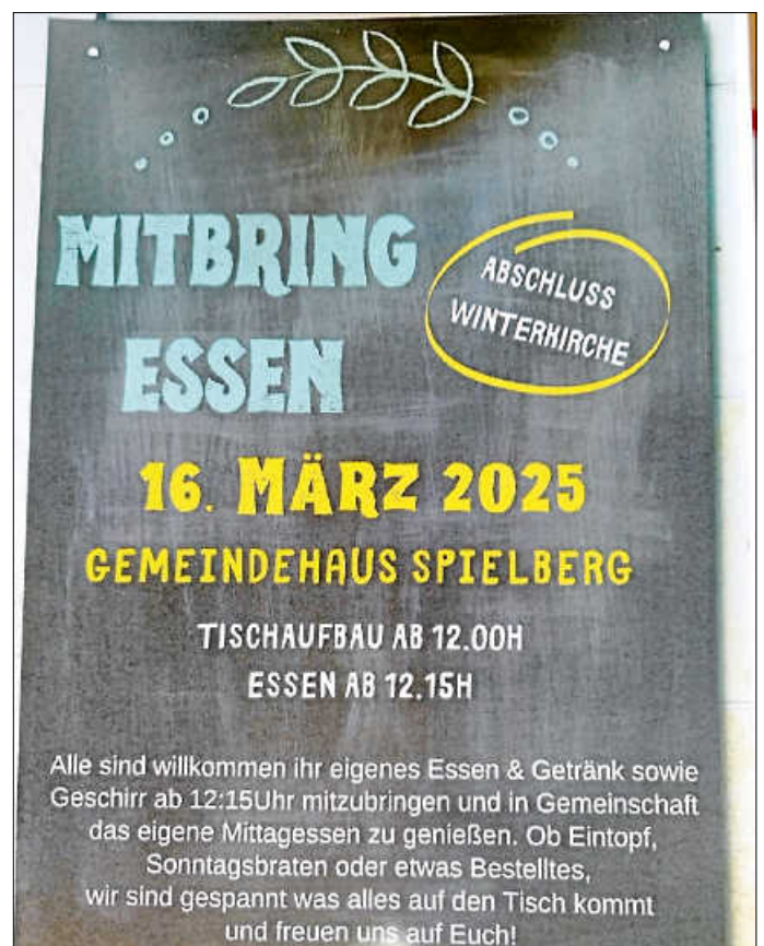
Plakat: Ev. Gesamtkirchengemeinde SpEg

6.00 Uhr Frühgebet 12.30 Uhr Konfirmandenunterricht 16 - 18 Uhr Bücherei geöffnet 17.30 Uhr Mädchenjungschar für Mädchen der Kl. 2 - 4 17.30 Uhr Mädchenjungschar für Mädchen der Kl. 5 - 6 18.00 Uhr Mädelskreis ab Klasse 7 19.30 Uhr Probe Kirchenchor