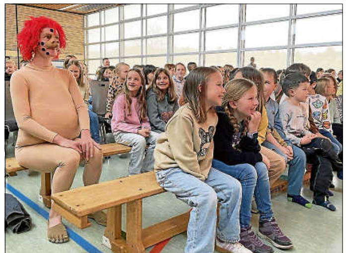
Das SAMS in der Silberdistelhalle

Aufgeführt wurde das beliebte Stück „ Das Sams – Eine Woche voller Samstage “, basierend auf dem Kinderbuchklassiker von Paul Maar.