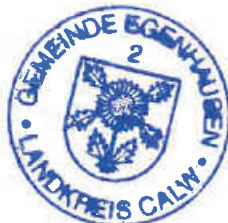
..... Bürgermeister Sven Holder