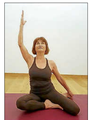
staatlich geprüfte Sport- und Gymnastiklehrerin

Ingrid Lipps ist staatlich geprüfte Sport- und Gymnastiklehrerin und derzeit als Dozentin bei der Volkshochschule tätig. Sie unterrichtet unter anderem die Kurse Rückenfit – Rückenkräftigung (ZPP-zertifiziert), Beckenboden in Balance, verschiedene Tanzthemen sowie Pilates in unterschiedlichen Kombinationen. Pilates – das systema-